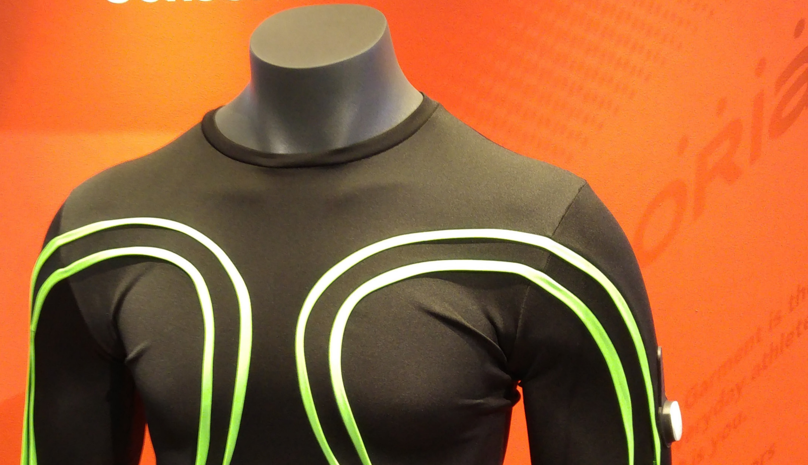
Smart Clothing ist die Zukunft